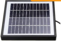
Ładowarka Baterii SOLAR PANEL